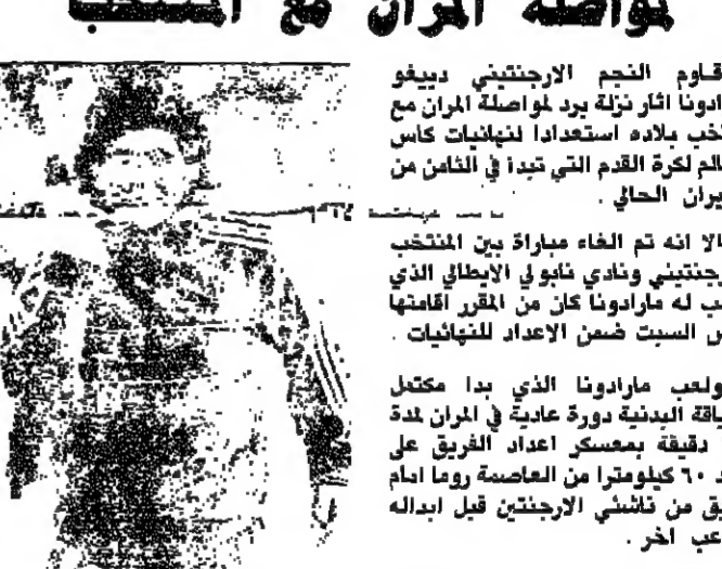
مارادونا خلال التدريب

قاوم النجم الأرجنتيني دييغو مارادونا اثر نزلة برد لمواصلة المراهنة مع منتخب بلاده استعدادا لنهائيات كأس العالم لكرة القدم التي تبدأ في الثامن من حزيران الحالي.